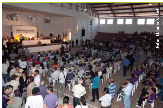
Interiorización en el municipio de Cacequi

Realizadas en 2011, en 11 ciudades, las Interiorizaciones se constituyeron como espacios de aproximación con la sociedad civil y de oportunidades para la participación presencial.