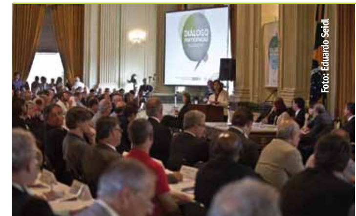
Reunión del Pleno del CDES en el Palacio Piratini