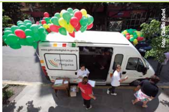
Camioneta de la Participación – recorrió el Estado recogiendo preguntas para el Gobernador

El Gobierno del Estado creó el Gabinete Digital, vinculado al Gabinete del Gobernador, un instrumento de participación virtual galardonado nacionalmente. Por medio de las herramientas de relación con la sociedad, como el Gobernador Contesta, el Gobernador Pregunta, el Gobernador Escucha y la Agenda Colaborativa, el Gabinete Digital se consolidó como un nuevo modelo de diálogo con las redes sociales y las prácticas virtuales, que obtuvo cinco premios nacionales, entre los cuales E-Gov, concedido por la Asociación Brasileña de las Entidades Estatales de Tecnología de la Información y Comunicación (Abep), y ARede 2011, de la revista ARede.