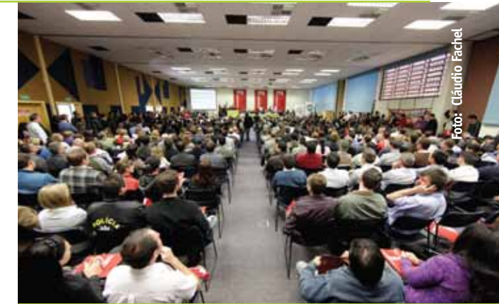
Seminario Regional del PPA Participativo en Passo Fundo

En mayo, junio y julio se elaboró de forma participativa el Presupuesto de 2012, con la participación de 60 mil personas reunidas en las tres primeras etapas - audiencias públicas regionales, asambleas municipales y microrregionales y foros regionales. El proceso fue consagrado el 10 de agosto, con la participación de 1.134.141 votantes, cuando se votaron las prioridades.